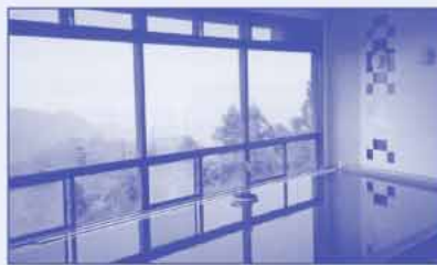
土佐備長炭 展望大浴場

展望大浴場 男女 各1 沸かし湯(土佐備長炭を湯船に入れることにより、お湯の分子を小さくし肌をやさしい柔らかなお湯になっています)