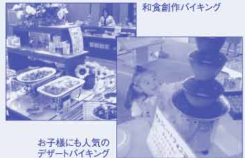
和食創作バイキング